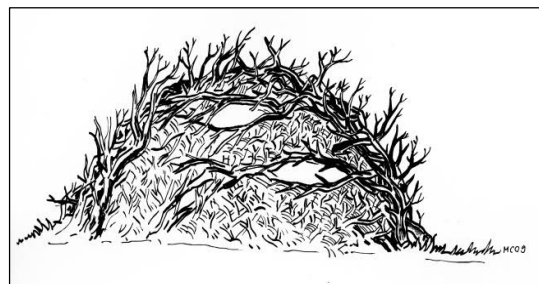
Asthaufen: Beim Bau sollte grobes und feines Material verwendet werden.