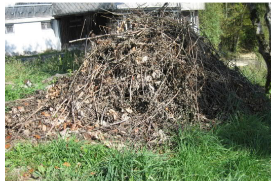
Ein Asthaufen ist Lebensraum für viele Tierarten