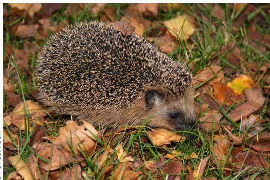
Für seinen Winterschlaf benötigt der Igel Ast- und Laubhaufen.

Damit sich möglichst viele Tier- und Pflanzenarten im naturnahen Garten wohlfühlen, braucht es unterschiedliche Lebensräume. Mit Holz- oder Steinhaufen sowie einheimischen Pflanzen bringen Sie natürliche Bedingungen in Ihren Garten. Oft steht bei der Gestaltung des Gartens unser eigener Ordnungssinn an erster Stelle. Das ist schade. Wussten Sie beispielsweise, dass im abgestorbenen Holz von morschen Bäumen, Ästen und Reisig - dem so genannten Totholz - Insekten, Vögel, Flechten, Pilze und Moose leben? Oder dass auch eine karge Kiesfläche lebendig ist? Auf diesen Flächen, auch wenn sie noch so klein sind, gibt es Spannendes in der Natur zu beobachten.